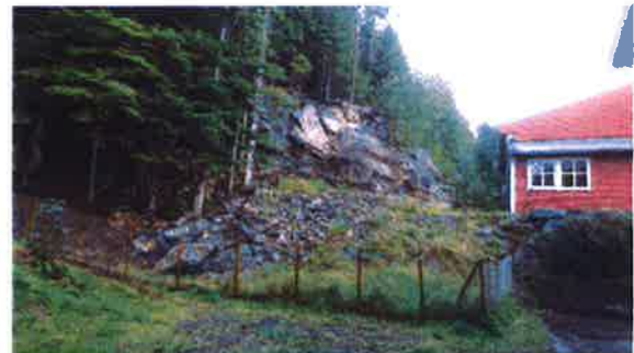
Manglande opprydding etter arbeid