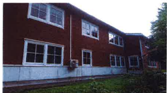
Manglande brannstige på to av klasseromma