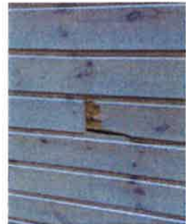
Hol i vegg i gymsal. Dårleg utført arbeid

Store kapasitetsproblem 23 punkt som må vurderast utbetra Bør få lås på medisinskap